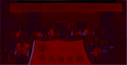
金龙商学院作为学校规模最大的二级学院，在教学、科研、实践活动等方面均表现出色。围绕晋江地区民营经济活跃、现代服务业专业群的区域

根据《中共福建省委教育工委关于开展“三全育人”综合改革试点工作的通知》（闽委教思〔2019〕11号），泉州轻工学院二级学院—金龙商学院党支部入围福建省“三全育人”综合改革试点院系（公示），是全省唯一一所入选的民办高校党支部，是对学校全面落实立德树人根本任务，全员、全程、全方位育人工作的肯定和鼓励！